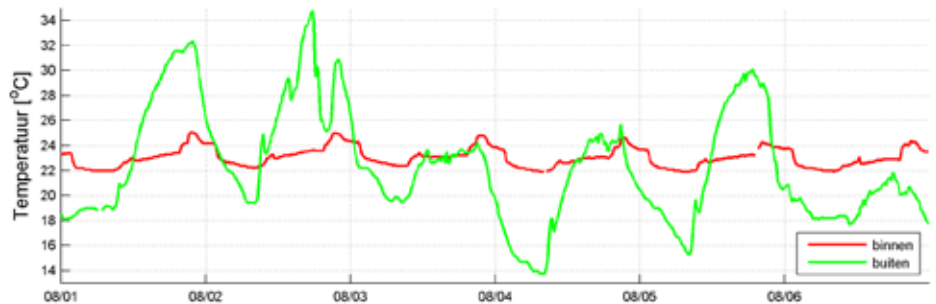
Keuken - BlueCasco (24/24)